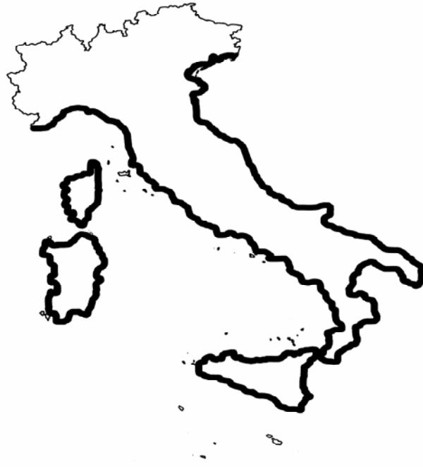
Fig. 38.1 – Distribuzione di Lophius piscatorius nei mari italiani e di Corsica. Distribution of Lophius piscatorius in the Italian and Corsican Seas.

I parametri della relazione taglia-peso sono riportati in tab. 38.1.